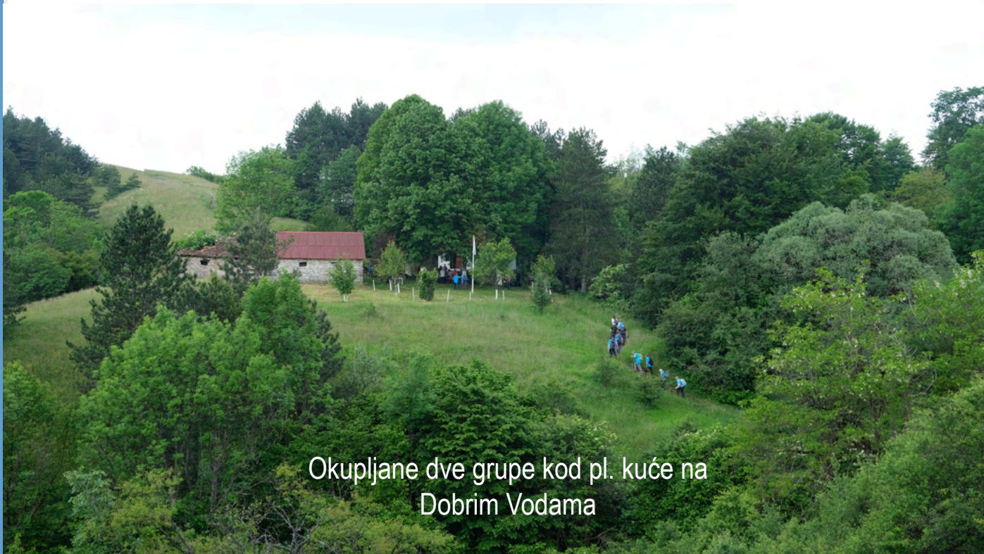
Okupljane dve grupe kod pl. kuće na Dobrim Vodama

Tako se kod Dobre vode sastalo ukupno 180 planinara. Svako je imao lanč-paket. Mnogi planinari sa kraće staze iskoristili su priliku i produžili do Suvobora, najvišeg vrha u ovom delu Srbije, na kom je spomenik junacima Suvoborsko-kolubarske bitke 1914. Time su prešli turu od 18 km.