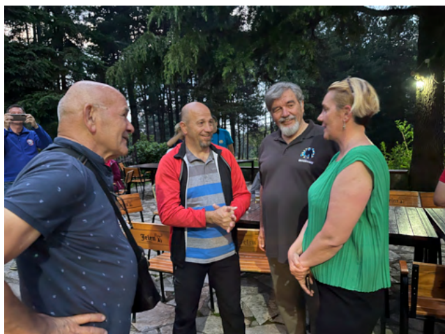
Dolazak i okupljanje planinara ispred pl. doma „Čika Duško Jovanović”, na Rajcu