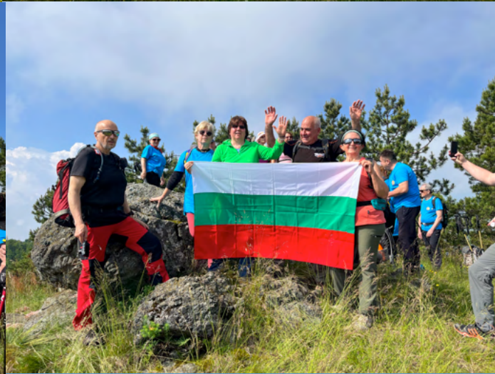
Vijuljak (823m), Danilov vrh (842 m), Suvobor (866 m) Spomenik junacima Suvoborsko-kolubarske bitke, 1914.