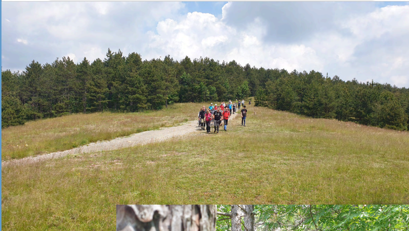
Na putu ka vrhu Suvobora